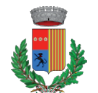
Comune di Monale